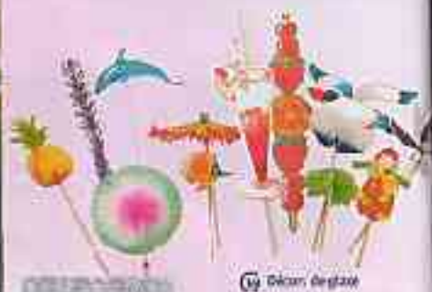
19 Décor d'entrée