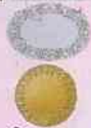
15 Assiettes Offerte d'entrée