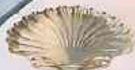
21 Plats copette