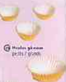
18 Hésite à donner petits / grands