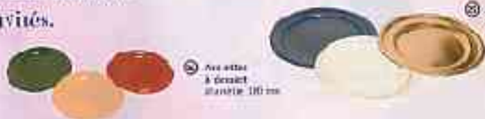
26 Assiettes à dessert assorties 100 mm

et pour les petits... et les plus grands.