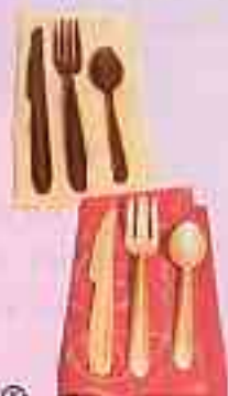
17 Couverts / Fourchettes Couverts Blanc