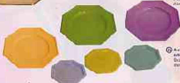
23 Assiettes octogonales Qualité supérieure Diamètre 140 mm

Une assortment d'assiettes et de sous-assiettes selon le nombre d'invités.