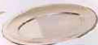
20 Plats de présentation Assortis à servir